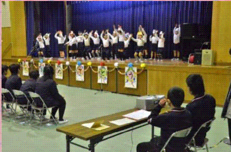
1年生 ダンス 妖怪体操第一