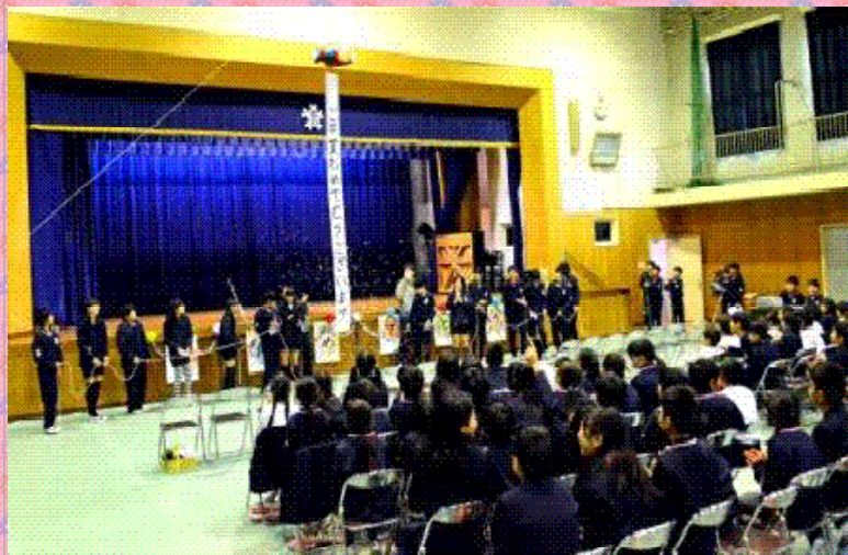
卒業おめでとうのくす玉

6年生を送る会を、行うことができました。内容は、1年生ダンス(妖怪体操第一)、2年生合奏(こぎつね・アイアイ)、3年生群読(夕日がせなかをおしてくる)、4年生合奏(ひまわりの約束)、5年生(リズムに乗せたメッセージ)で、どの学年もみんな一生懸命やってくれました。その後、先生達の合唱「栄光の架け橋」をピアノとギターやエレキギターに合わせて歌いました。そして、6年生児童をあてるシルエットクイズ(わたしはだれでしょう)をしてくださいました。在校生達は、日頃から6年生の姿をよく見ているので、シルエットの姿を見たら、だれだれですと、すぐに言っていました。最後に6年生は、自分達が考えた(新喜劇)をやってくれ、在校生みんなを楽しませてくれました。6年生にとって、思い出に残る楽しい送る会になりました。保護者のみなさんもたくさん来ていただき、ありがとうございました。