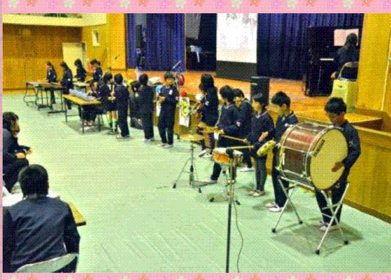
4年生 合奏 ひまわりの約束