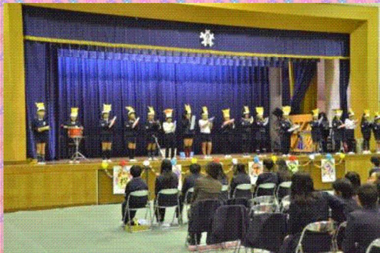
2年生 合奏 こぎつね・アイアイ