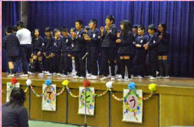
5年生 リズムに乗せたメッセージ