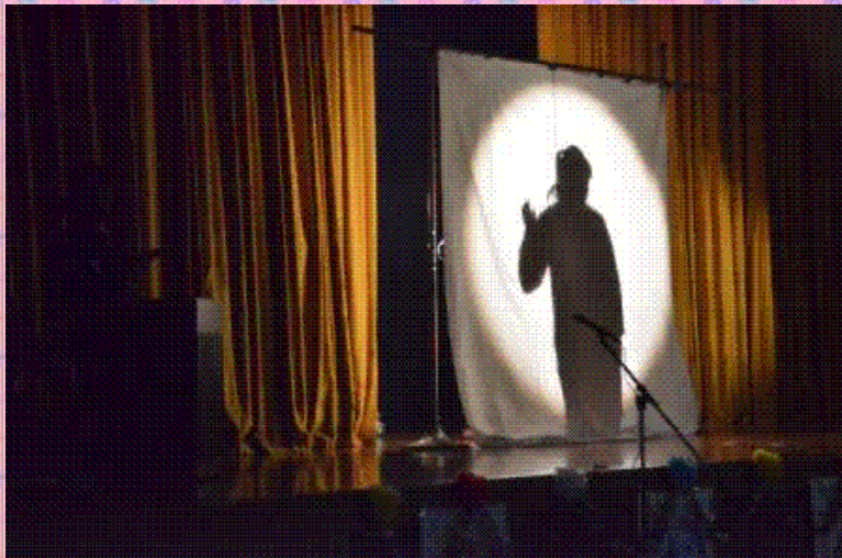
シルエットクイズ