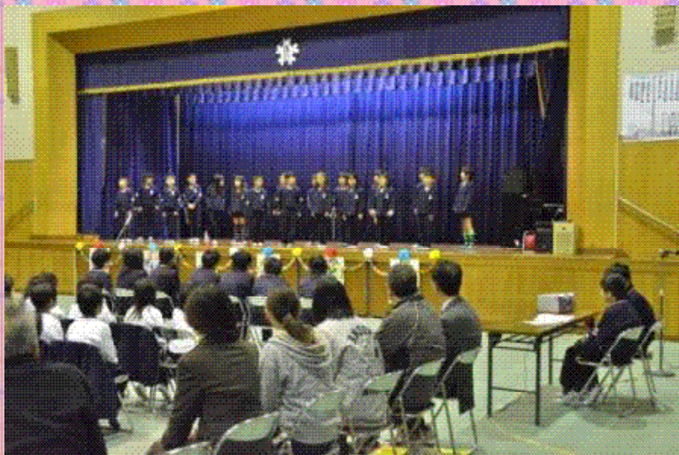
3年生 群読 夕日がせなかをおしてくる