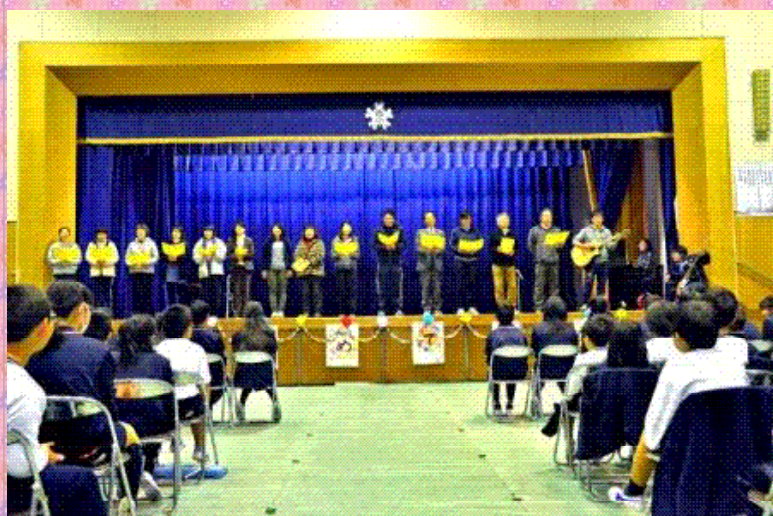
先生達の合唱 栄光の架け橋